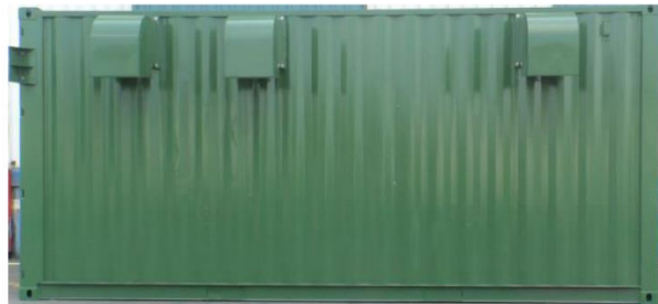
【サブステーション】 側面写真