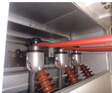
【受電設備内部結線】