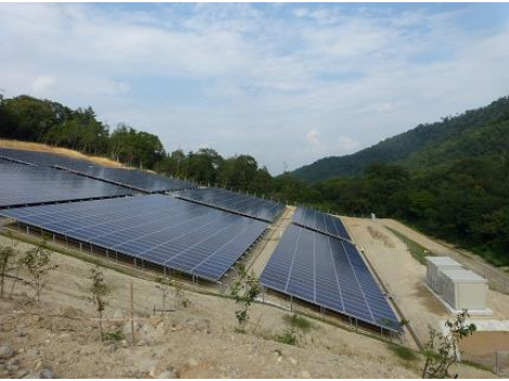
【メガソーラー施設事例】